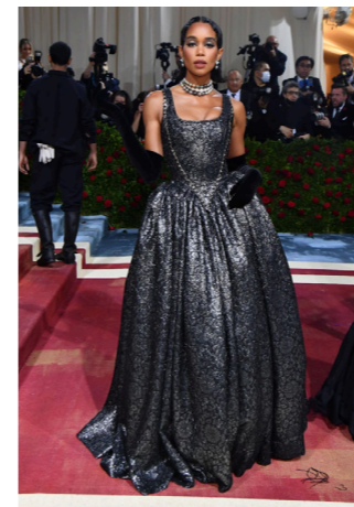
Laura Harrier i en H&M-klänning tillsammans med smycken från David Yurman.

Tror ingen har missat månadens största modehändelse - The Met Gala. Det här är första gången det hållits en tvådelad utställning på temat amerikanskt mode. Del ett hölls i september förra året där temat var In America: A lexicon of fashion. Nu var det dags för utställningens andra del med temat In America: An Anthology of Fashion. Klädkoden var Gilded Glamour, ett uttryck myntat av författaren Mark Twain som hänvisar till storheten i Gilded Age New York, tidsperioden mellan år 1870 och 1890. Han menade att denna tidsperiod kännetecknades av ett oöverträffat välstånd, en kulturell förändring och industrialiseringen i Amerika. Personligen var jag väldigt taggad på att se alla de stora, fluffiga och eleganta klänningarna som skulle återspegla temat - dessvärre blev jag besviken över galabesökarnas försök till att förkroppsliga storhetstiden. Trots det ikoniska ögonblicket med Kim Kardashian klädd i Marilyn Monroes klänning från John F. Kennedys 45:e födelsedag år 1962, var det inte riktigt rätt i tiden, något som återkom under hela galan. Men jag har såklart några favoriter.