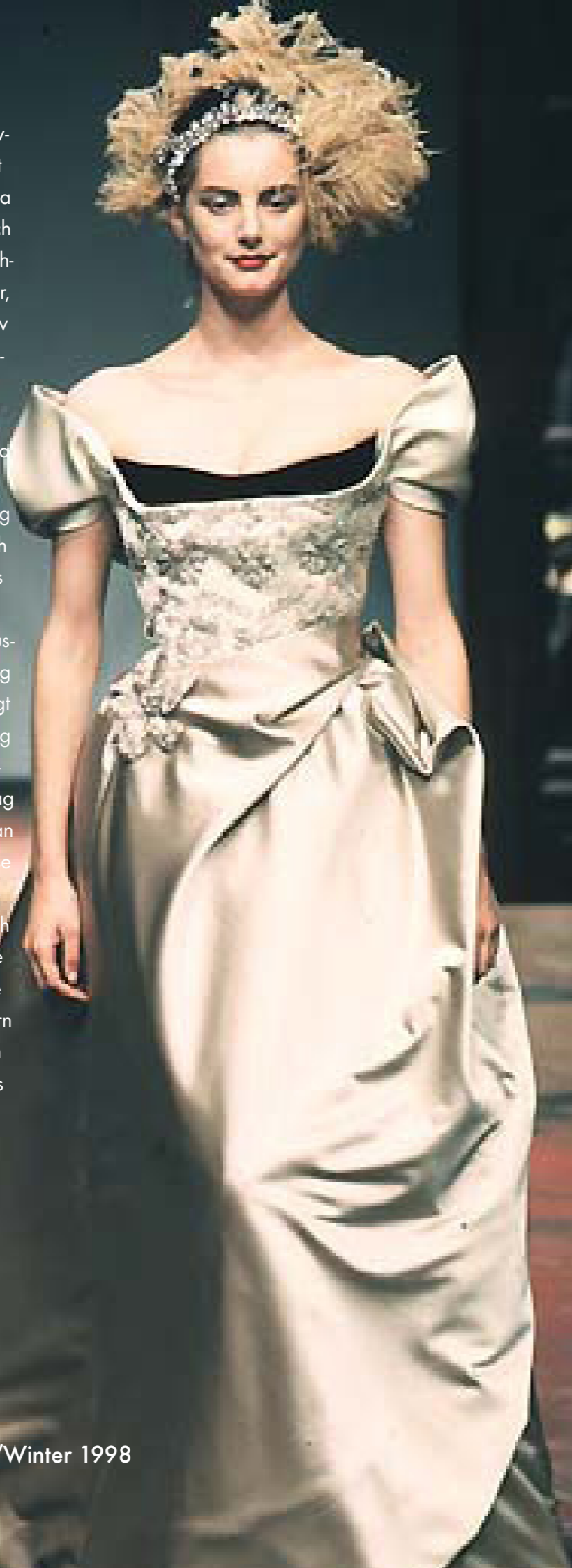
Bild: Christian Lacroix Fall/Winter 1998

I och med det skulle jag vilja hävda att Met Galan är en utmärkt chans att göra precis det, uppvisa sin prestige och förmögenhet, och att klädkoden är en perfekt matchning till galan. Kända filmstjärnor, artister och modeller är några av de mest intresseväckande personer som gästar galan prydda i designers storslagna skapelser och många gånger även dyrbara smycken. Det går hand i hand med självaste uppfattningen kring klädkoden "gilded glamour" och epokens tidsanda att samhällets elit får visa upp sig själva. Det brukar oftast uppkomma en diskussion efter varje Met Gala vare sig gästerna faktiskt klätt sig enhetligt med årets tema och i år skulle jag säga att klä sig extremt överdådigt är den rätta vägen att gå. Jag hoppas att vi, på den röda mattan den första måndagen i maj, får se många olika material och blandade textilier, mycket detaljer och utsmyckning. Men hade det inte också varit kul att se invecklade frisyrer och hattar med en modern twist! Tiden får avgöra vad som kommer att presenteras på årets Met Gala.