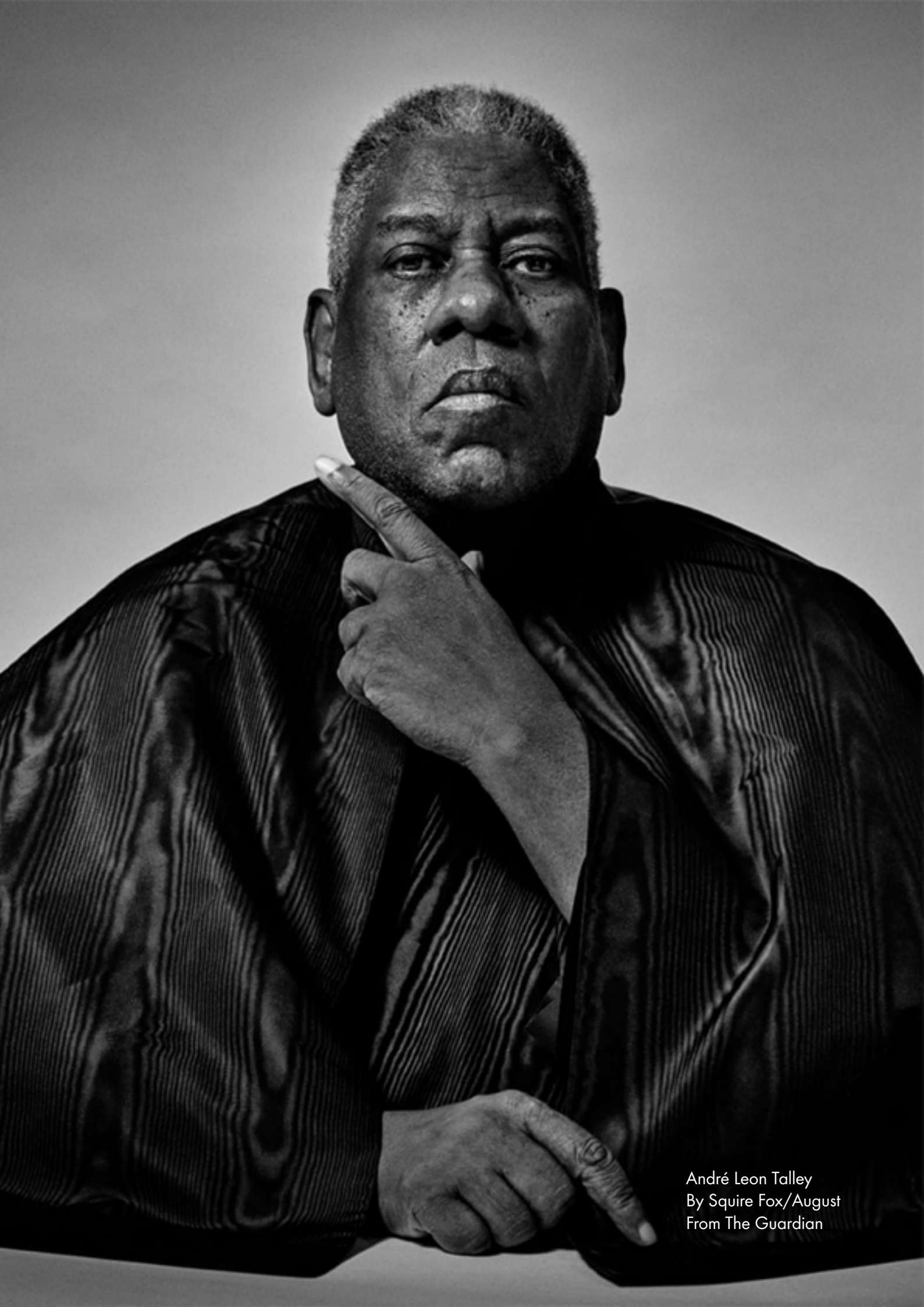
André Leon Talley